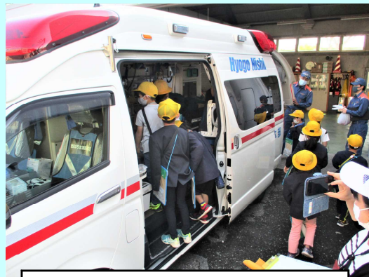
2年「まち探検」10月28日 神部校区内のいろいろな施設を見学しました