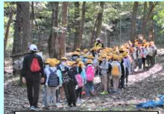
3年「ヤッホの森探検」10月29日 揖保川21の方にお話をうかがいました。