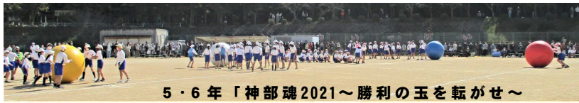
5・6年「神部魂2021～勝利の玉を転がせ～」