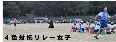
4色対抗リレー女子