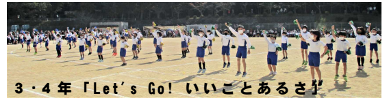
3・4年「Let's Go! いいことあるさ」