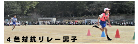
4色対抗リレー男子