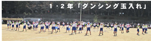
1・2年「ダンシング玉入れ」